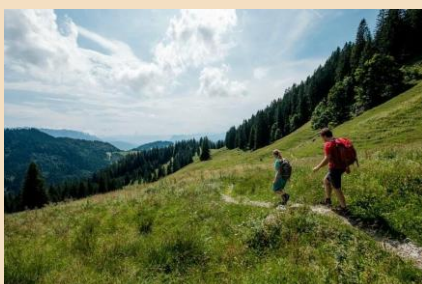
Wandern im Chiemgau.